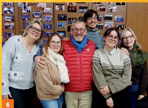
5. Le groupe Molière dans « Hors Piste » 6. Le groupe Marivaux dans « Vos dernières Volontés ».