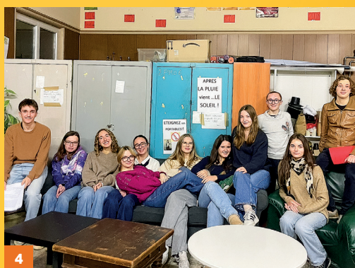
1. Les Brighella 1 dans « Le Pacte » 2. Les Brighella 2 dans « Populaire » 3. Les Arlequin dans « La vengeance est un plat qui se mange froid » 4. Les Scapin dans « Ceux qui restent ».