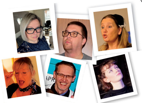
Les membres du bureau

Chères spectatrices, Chers spectateurs, merci beaucoup par avance pour votre fidélité et votre future venue. Nous vous attendons avec impatience ! Bonne lecture à tous, et à bientôt.